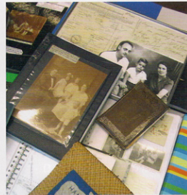
Een familiearchief uit de collectie van Stichting Indisch Familiearchief (Den Haag).