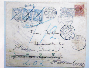
Post uit het archief van Spaak Systra (Den Haag).

Een andere mogelijkheid is dat SFB nog geen eigen bewaarplaats gaat behouden, maar zich eerst op ondersteunende taken zal toeleggen. SFB stimuleert samenwerking tussen particulieren en reguliere archiefinstellingen en kan zich bijvoorbeeld met de ontsluiting van familiearchieven bezighouden, en het verloren gegaane Centraal Register van Particuliere Archieven opnieuw opzetten. Het lokaliseren en inventariseren van een archief vormt een essentieel onderdeel van het duurzame beheer. SFB vervult daarbij in de eerste plaats de rol van bemiddelaar. Later kunnen de taken uitgebreid worden en de dienstverlening die specifiek depotruimte voor particulieren aanbiedt.